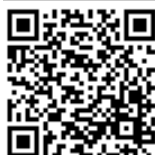
TABELA nº 03 – CGJ