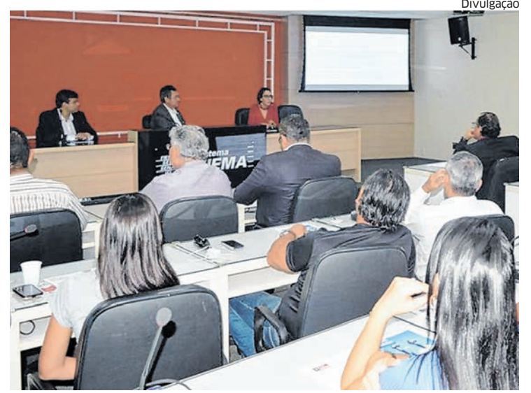
Membros do Conselho da Fiema durante a reunião realizada quarta-feira

Cronograma de saque: Quem possui poupança na Caixa ou quem fez adesão ao recebimento na conta corrente seguirá o cronograma abaixo para receber os valores do FGTS automaticamente.