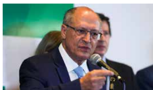
O vice-presidente eleito, Geraldo Alckmin, afirmou não haver pressão para anúncio de futuros ministros

Alckmin assegurou que os nomes dos integrantes do grupo técnico da Defesa devem ser anunciados até, no máximo, a próxima quinta-feira (24). Segundo o vice-presidente eleito, o grupo de trabalho será composto por