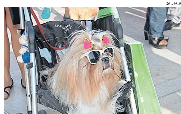
Animais em edição passada da Cãominhada, com fantasias e adereços

Todos os inscritos no evento receberão um kit contendo a camisa da “Cãominhada” e brindes dos patrocinadores, que são a Terrazoo e a clínica veterinária Quatro Patas. A entrega do material será realizada nos dias 29 e 30 deste mês, na loja da Terrazoo, na Cohama. O participante deve apresentar com-