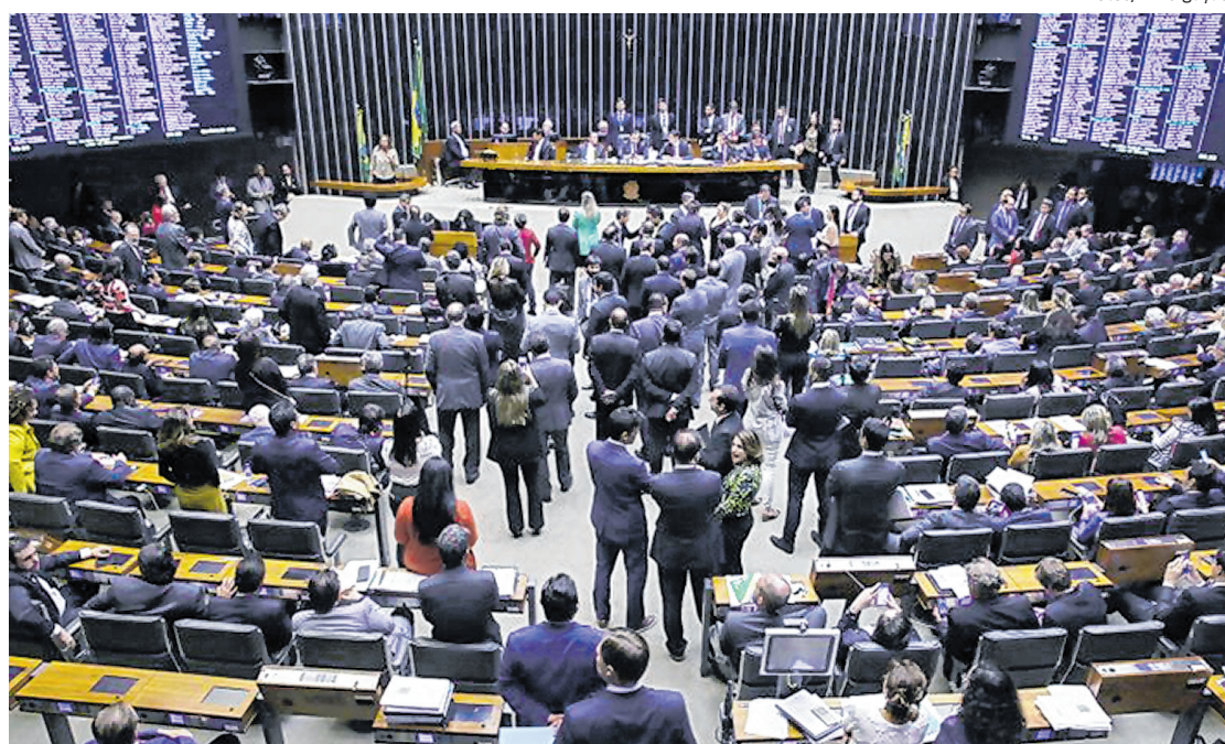
Mesa Diretora da Casa terá de fazer a leitura de ofício para que matéria vá para votação no Plenário

O texto do deputado também muda a MP original quanto à regra de dispensa de qualquer licença prévia para liberar atividade de baixo risco. Ele acaba com a exclusividade para o caso de sustento próprio ou da família para