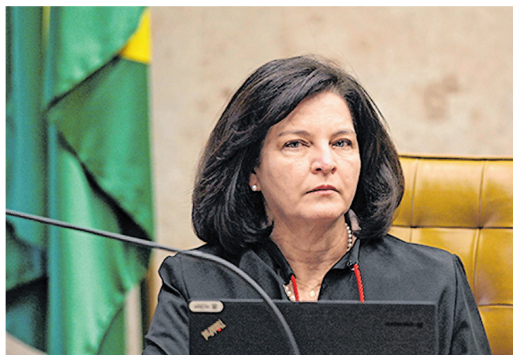
Raquel Dodge tem a prerrogativa de ser reeleita para o cargo

Entre as 27 forças-tarefa em funcionamento existem seis ligadas à