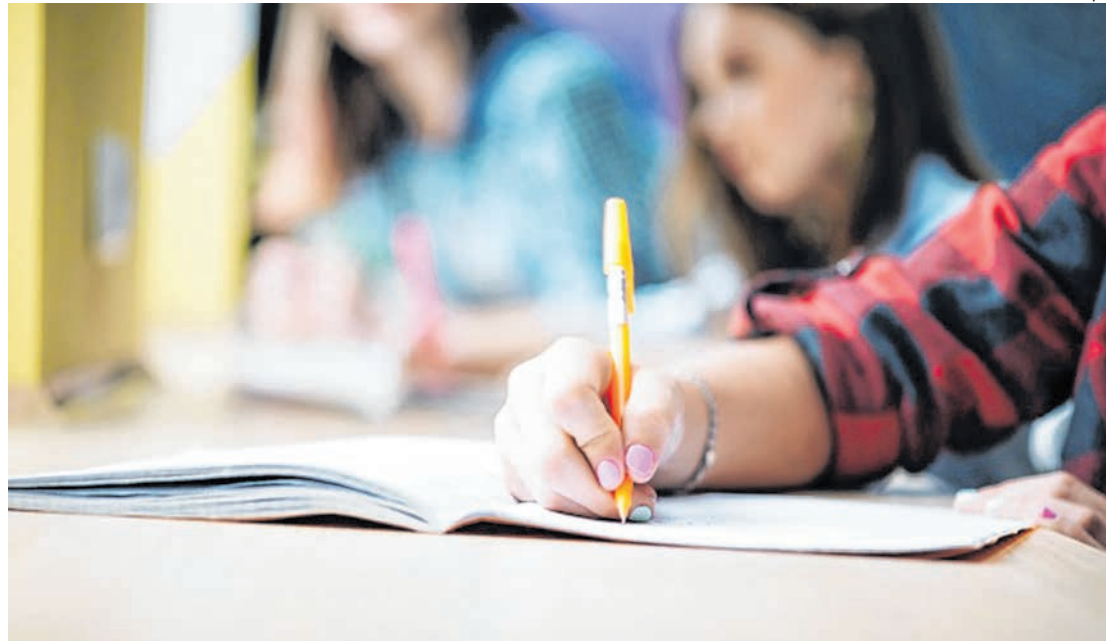
PNAD apontou que no Maranhão o grau de instrução é cada vez menor à medida que a idade avança

Ainda com relação ao nível de instrução, que é o indicador que capta o nível educacional alcançado por cada pessoa, independentemente da duração dos cursos por ela frequentados, o índice de quem completou o Ensino Superior passou de 8,6%, em 2018, para 9,1%, no ano passado. “Contudo, dentre as Unidades da Federação (UF), o Maranhão apresentava o menor percentual de pessoas de 25 anos ou mais com nível superior completo.