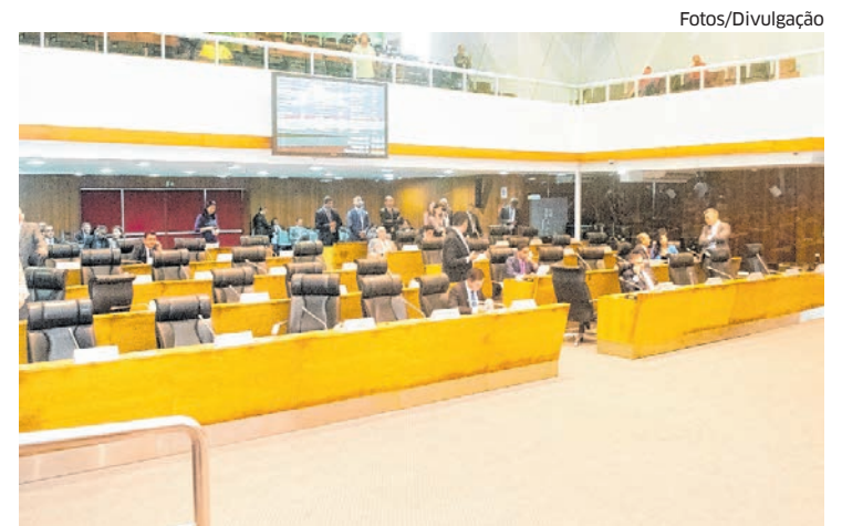
Sessões presenciais serão retomadas a partir de hoje, na Assembleia