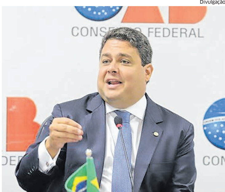
Denúncia contra Santa Cruz foi feita pelo Ministério Público Federal

noso, mas sim, apesar de reconhecido um exagero do pronunciamento, uma intenção de criticar a atuação do ministro. Desta feita, não vislumbrando o dolo específico para cometimento do crime de calúnia, entendo como atípico o fato narrado na denúncia”, concluiu. ●