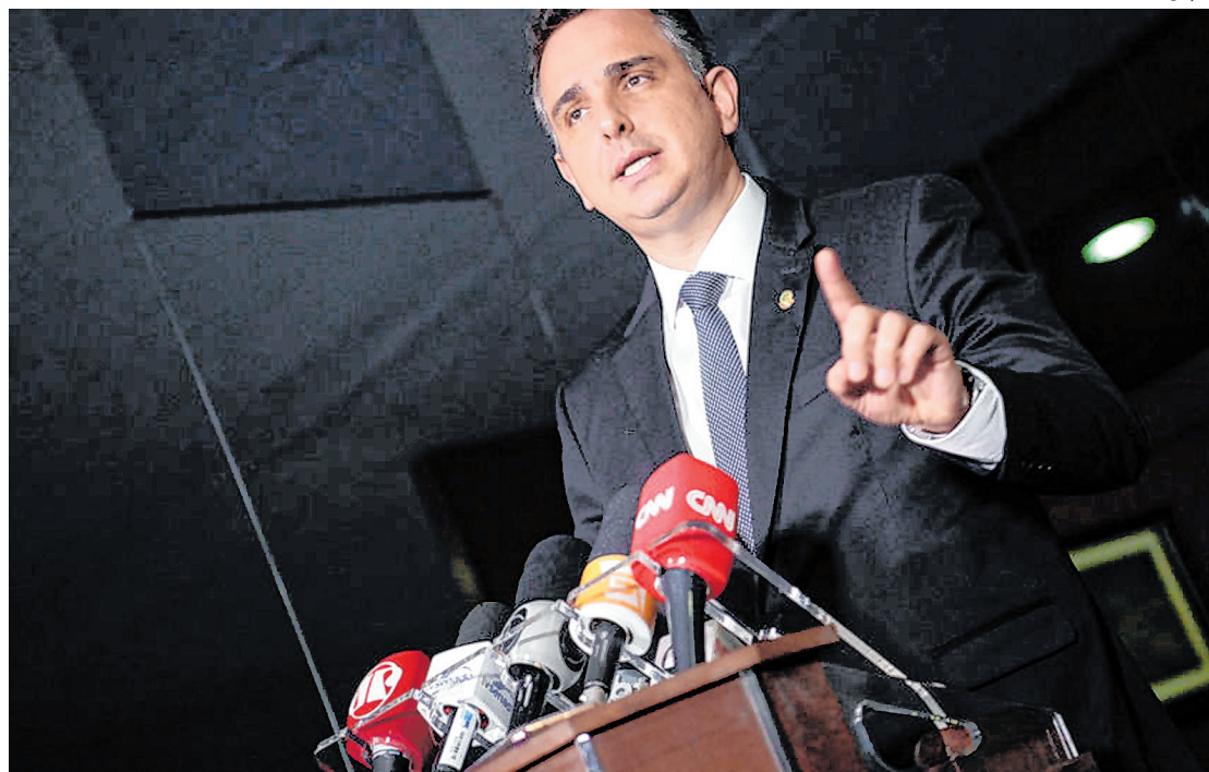
Rodrigo Pacheco disse que possibilidade de “frustração eleitoral” de 2022 é algo repudiado pelo Congresso

Sem se referir nominalmente a Bolsonaro, Pacheco contestou. Segundo Rodrigo Pacheco, “a democracia está consolidada, assimilada pela socie-