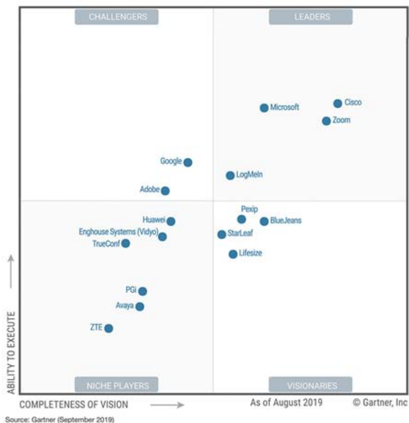
Figura 1 : Quadrante Mágico Gartner para soluções de videoconferência

Consideramos como alternativas de aquisição as 03 (três) das ferramentas líderes de mercado, Microsoft Teams ; Zoom Meetings ; Cisco Webex , conforme indicação do Quadrante Mágico Gartner apresentado na Figura 1.